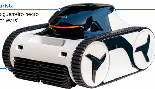
A - Aspirador X-Warrior (até 8h)

Sistema de navegação inteligente e 7 sensores.