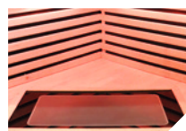
Painel de chão de carbono