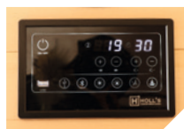
Audio Bluetooth /MP3