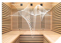
Alto-falante de ressonância