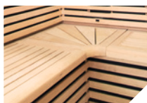
Banco e encosto de cabeça de Abachi