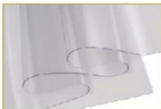
PVC Cristal 0,75mm

NOVO! Dois postes horizontais e outro vertical de metro a metro, fabricados em alumínio anodizado, em tubo de 25mm. A vedação é revestida com tecido de pvc de 0.75mm de espessura, com tratamentos aos Uv's, transparente.