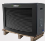
Se entrega en palé de madera

La Jetline Premium Fi conserva no obstante todas las ventajas que le han dado su éxito: su funcionamiento reversible le permite funcionar a partir de -15 °C, su desescarche automático y su intercambiador Twisted Tech de titanio garantizado por 15 años. Convencido por la excelencia de sus productos, Poolex amplía la garantía de la Jetline Premium Fi a 3 años,